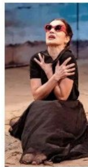
Imagen de Noche de reyes .