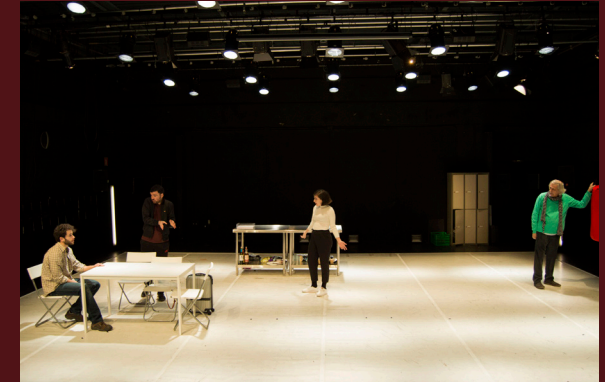
2019.- La Constitución

En 2019 comenzó su andadura de forma académica en la RESAD, donde fueron perfilando su estilo en los montajes "La Constitución", de Mickaël de Oliveira, y "Los nomeolvides", de Adrián Perea.