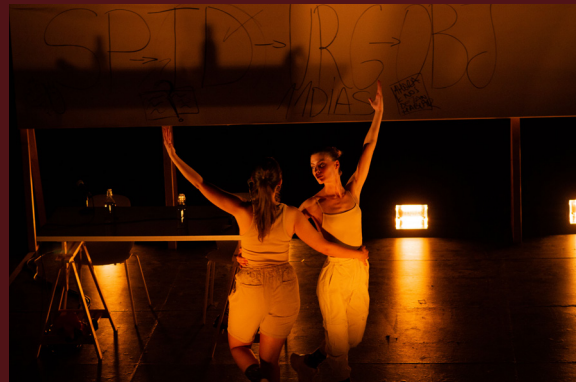
2021.- Ahora que nos dejan hablar