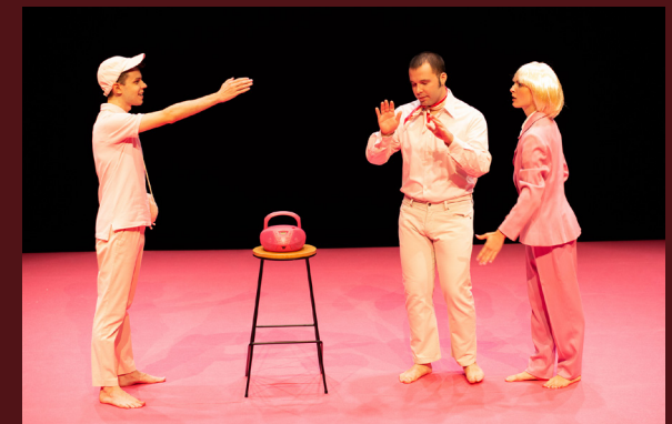
2021.- Los chicos de Baker-Miller