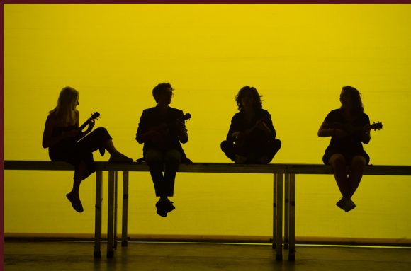
2019.- Los nomeolvides